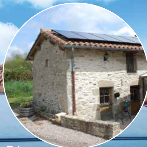
Tolosa Casa individuale 6 pannelli