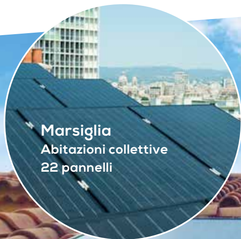
Marsiglia Abitazioni collettive 22 pannelli