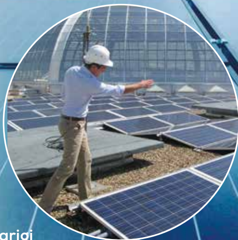
Parigi Sede centrale de Bouygues Construction 180 pannelli

Rendetevi indipendenti nella produzione della vostra energia: